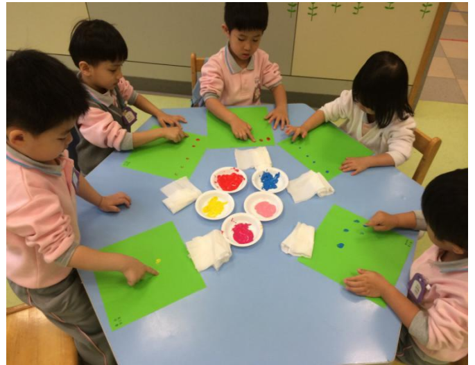
讓我把手擦干净再换其它颜色。