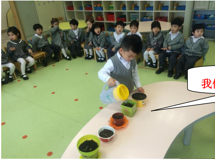
我們天天給種子澆水，觀察種子的成長。