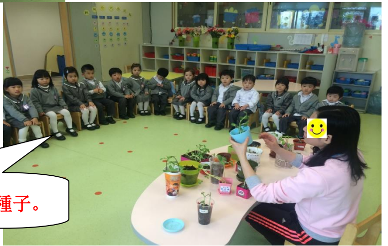
我們很認真聽老師介紹各種發了芽的種子。