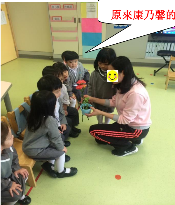
原來康乃馨的種子發了芽是這樣的。