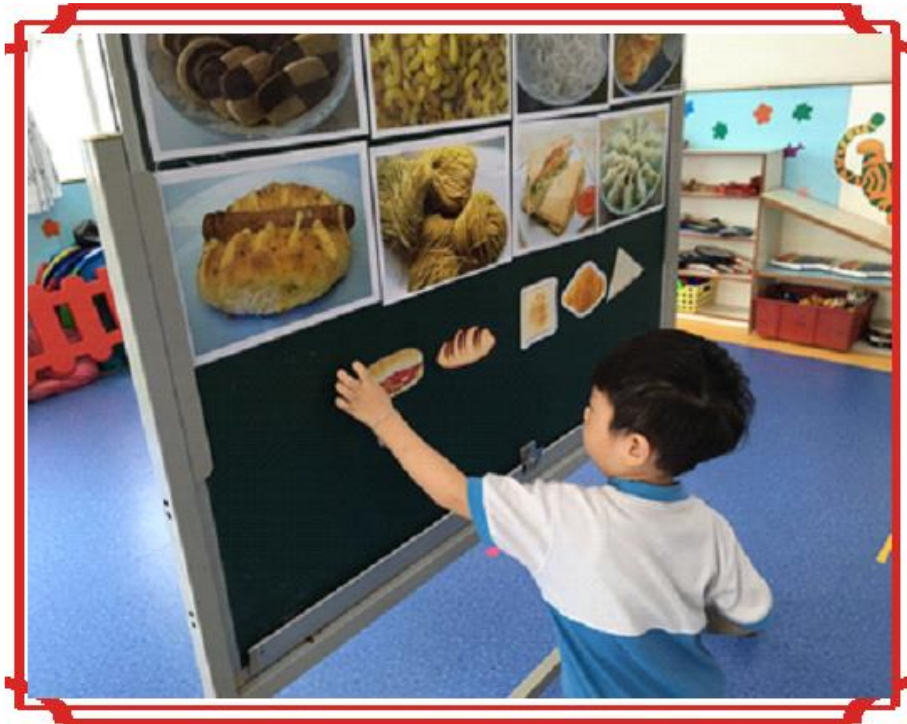
我喜歡的食物係香腸飽