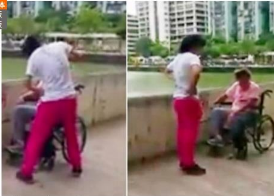
涉事女子疑虐打坐輪椅的婆婆。

【on.cc東網專訊】網上近日流傳一段女子涉虐打輪椅婆婆的片段，片中的傷殘婆婆不停被女兒呼喝、掌摑，短片迅速惹網民熱烈討論，網民對不孝女的行為大感不齒，怒轟會「昇雷劈」。原來有關事故是發生在澳門，事件在當地亦掀起很大風波，最新消息是澳門社工局已安排婆婆入住護老院舍。