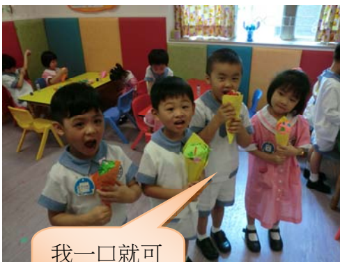
我一口就可 吃掉這雪糕