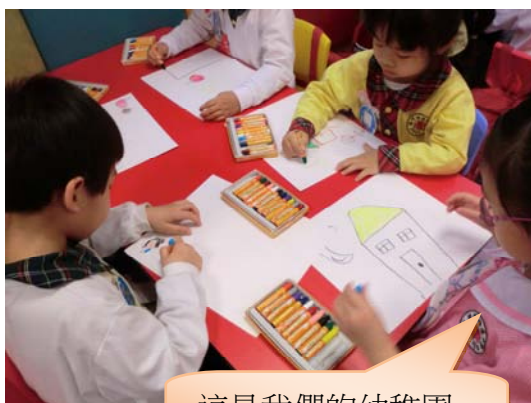
這是我們的幼稚園。