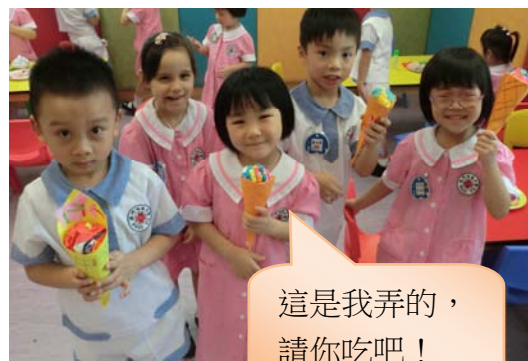
這是我弄的， 請你吃吧！