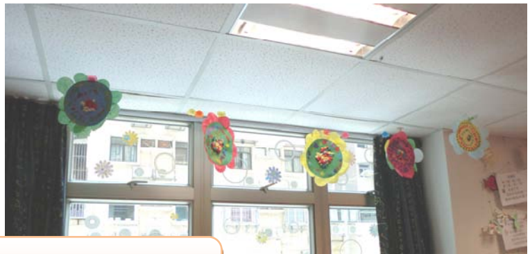
掛在課上，滿載春天氣氛