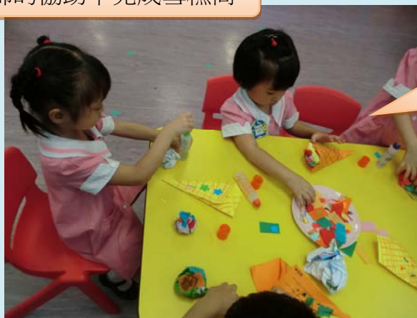
我在幫雪糕 加點糖果