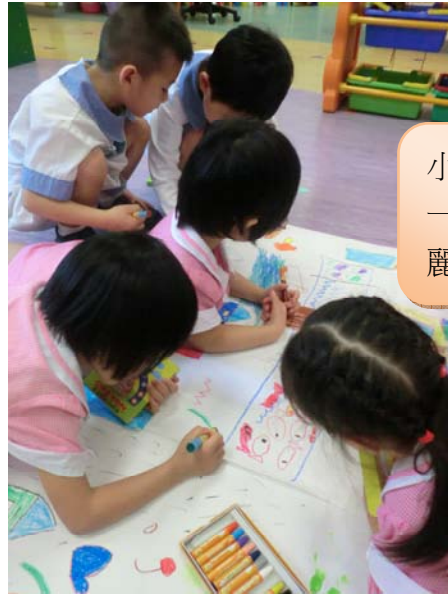
小朋友分工合作 一步一步的為美 麗村加工。