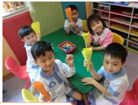
在老師的協助下完成雪糕筒