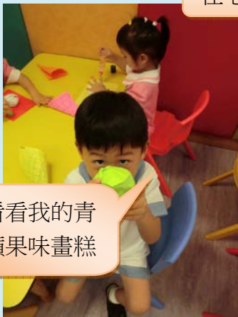
看看我的青 蘋果味畫糕