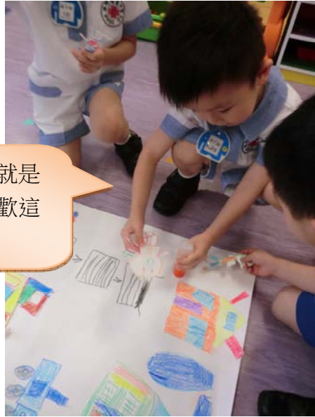
這個小朋友就是 我，我很喜歡這 個美麗村