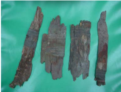
製造紙的原材料--樹皮