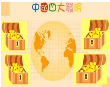
藏寶圖的投影片，藏寶圖內有四個寶箱，收藏了中國四大發明。