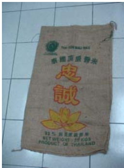
製造紙的原材料--麻布