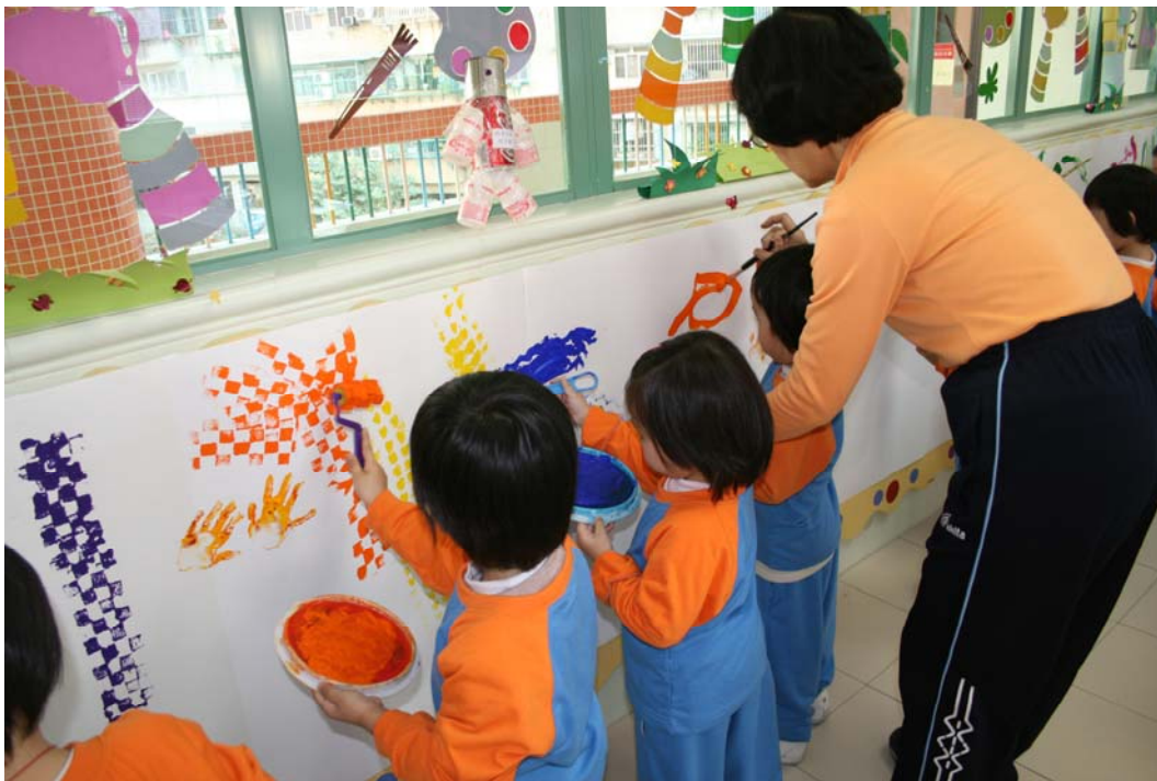
老師，快來看看我們的作品!