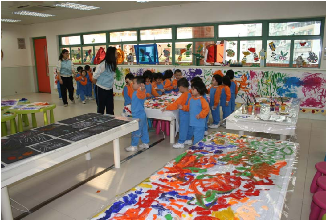
看看！我們的作品多漂亮。