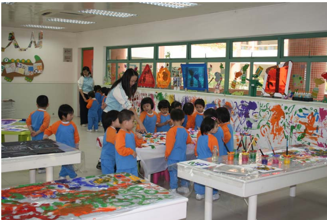
一起來看看我們的作品。