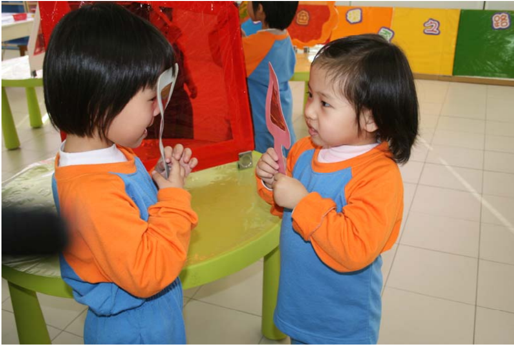
哈哈！你變了不同的顏色哦！