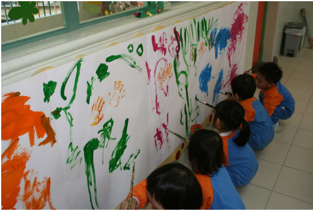
這是超人呀，快來看。