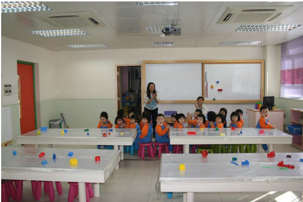
幼兒運用不同顏色的玩具佈置課室。