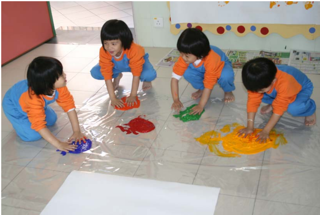
聽隨音樂運用肢體進行創作活動。