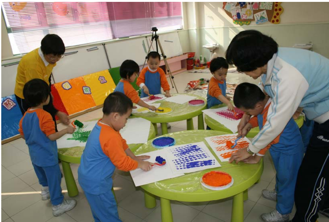
滾、滾、滾! 滾出美麗的圖畫。