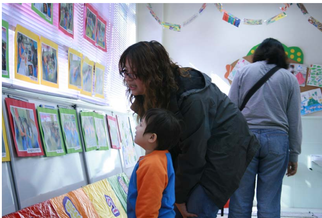
小朋友做導遊帶領家長參觀展覽作品!