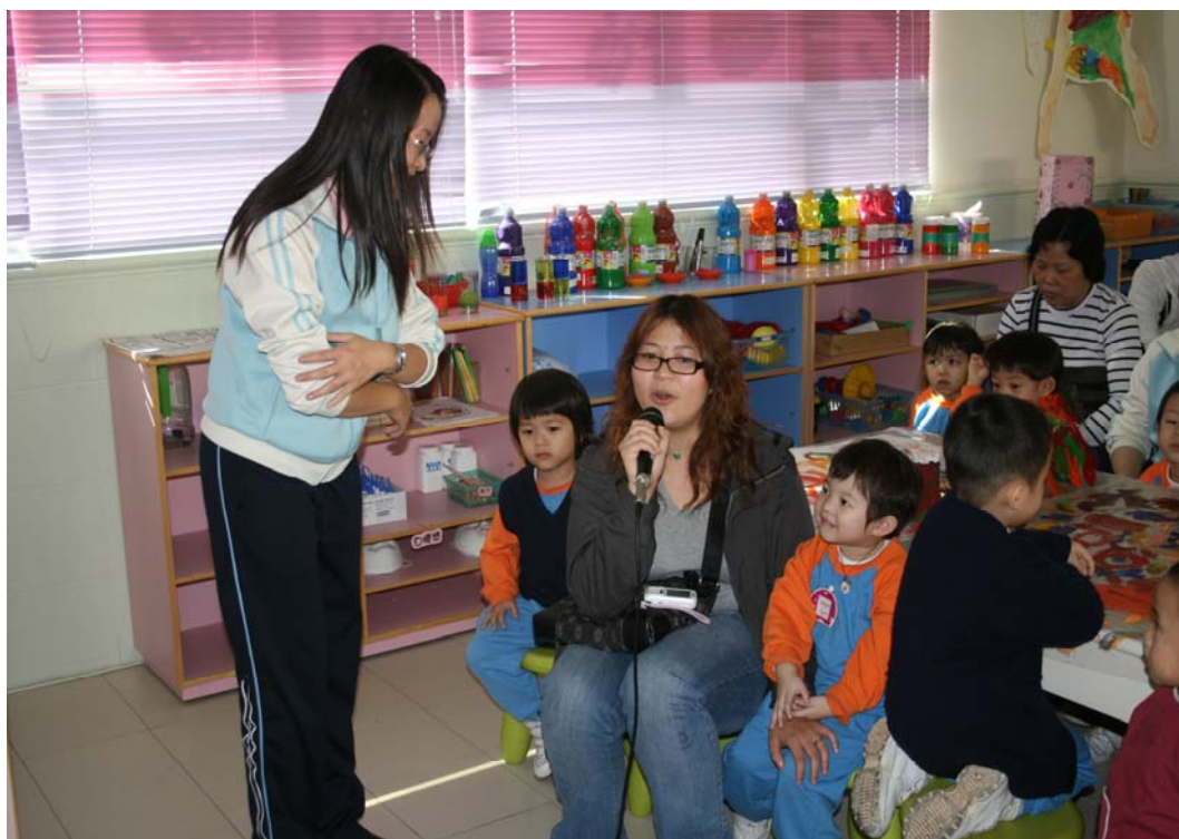
親子會上，家長發表心聲!