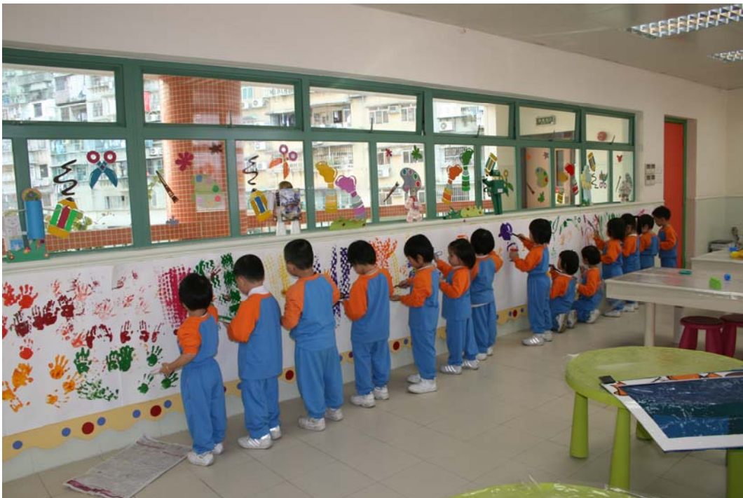
看我滾出甚麼東西來！