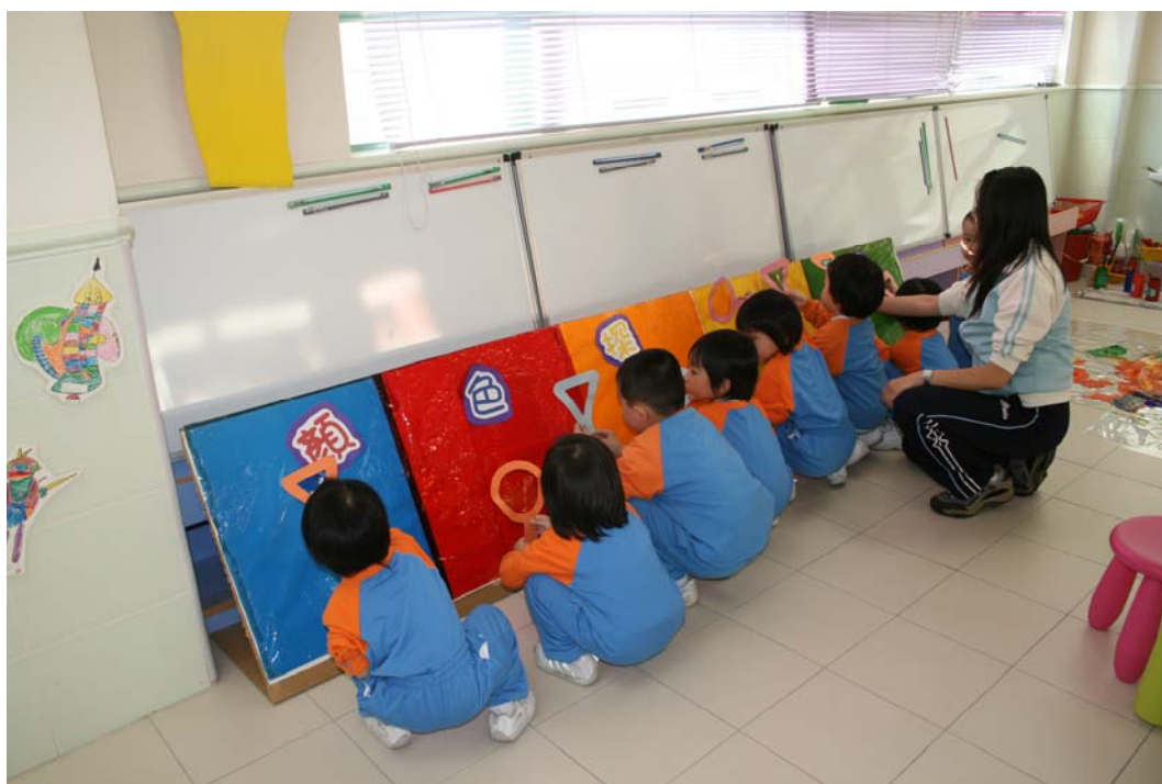
彩鏡併併樂，你看！顏色改變了。