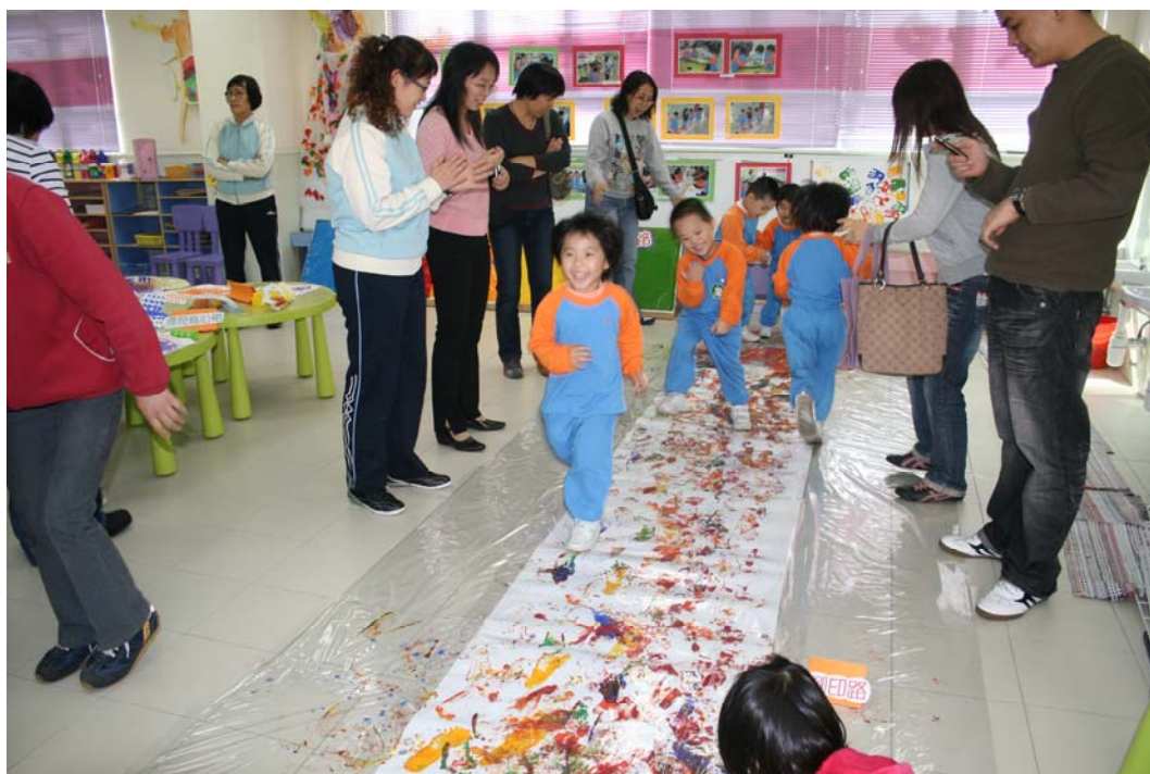
老師、家長、小朋友愉快地分享成果!