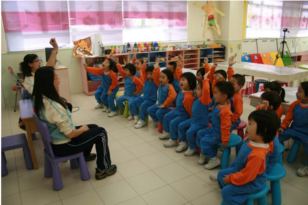
幼兒踴於發言，積極投入活動。