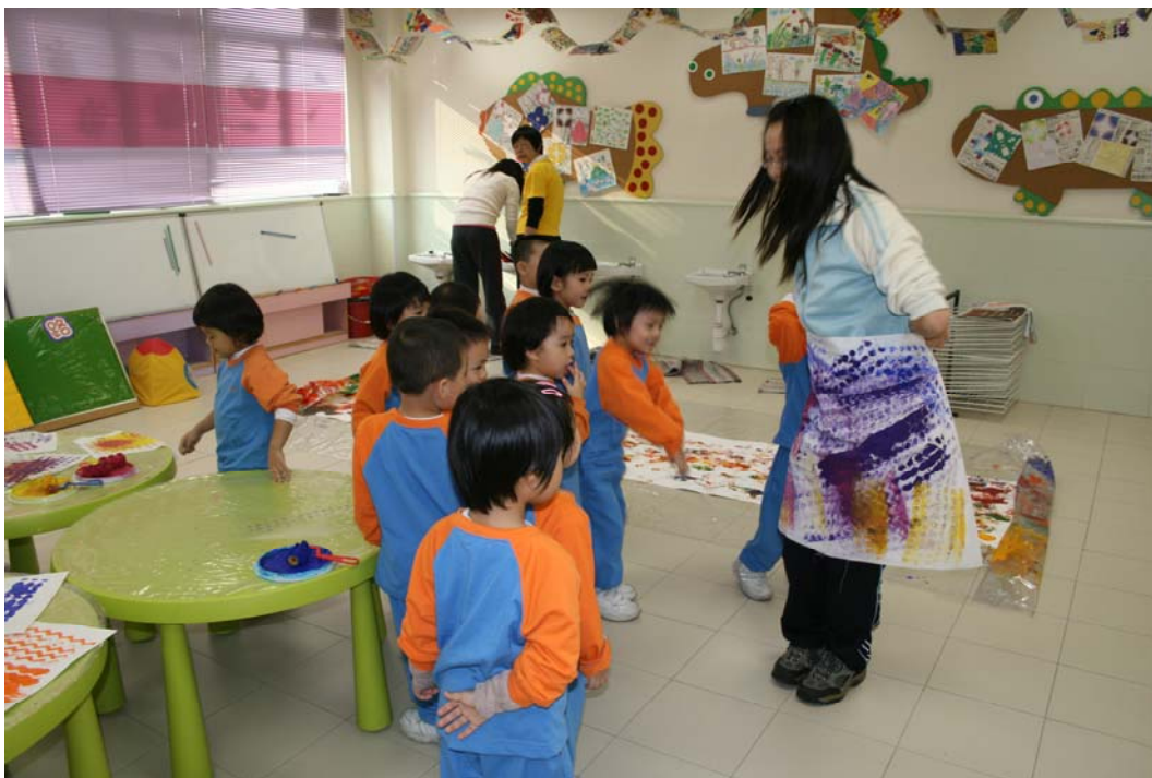
學生建議用布幫老師做裙子。