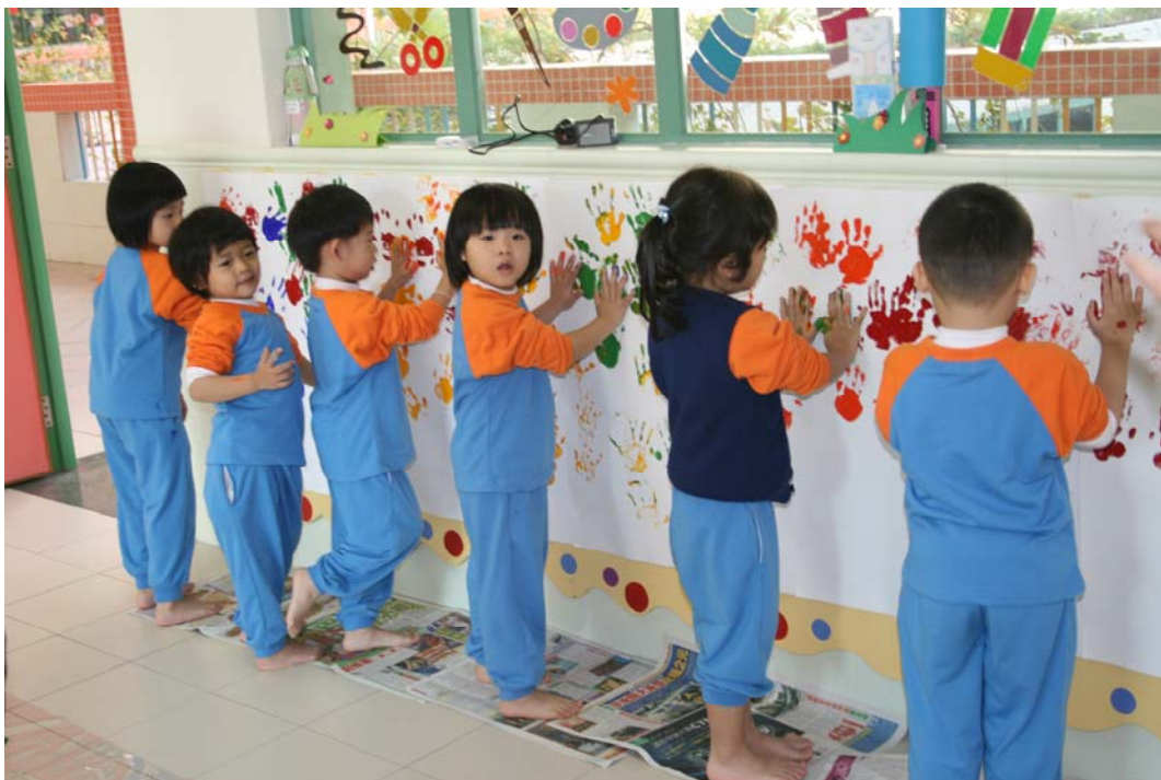
聽著音樂進行印手板活動。