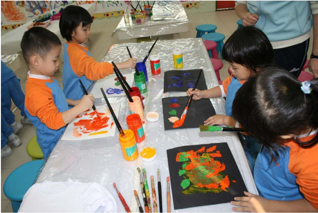
看我的圖畫多美麗，顏色變化多。