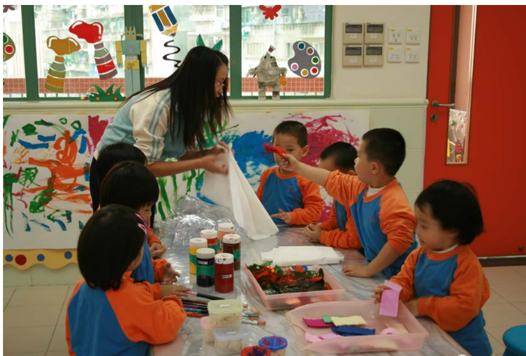
幼兒在課室內尋找不同物料進行創作活動。