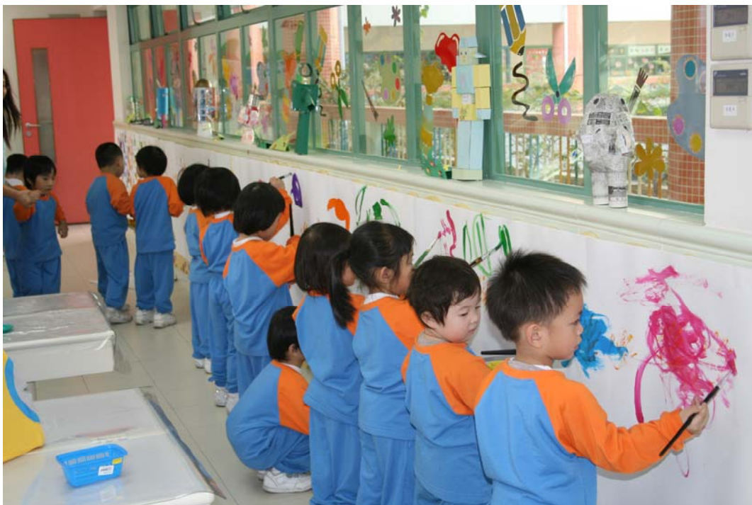
打風了，看我的龍捲風。