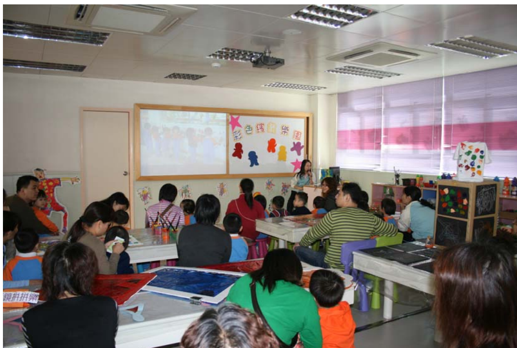
親子會上老師向家長介紹活動的情況!