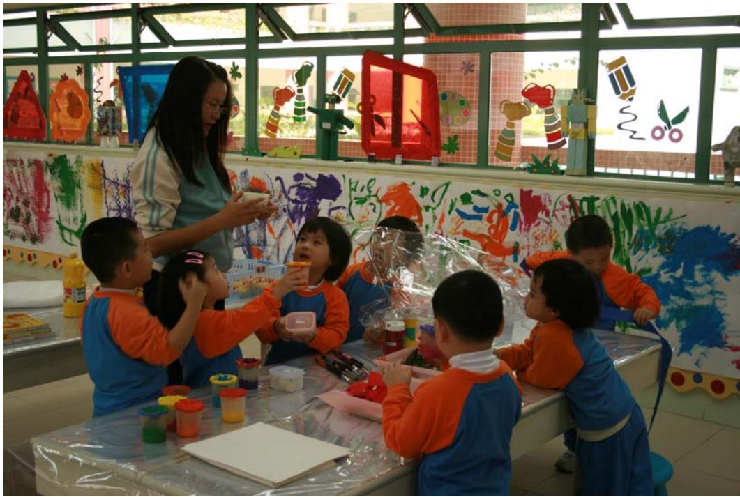
顏色不單止畫在畫紙上，連膠片都可以。