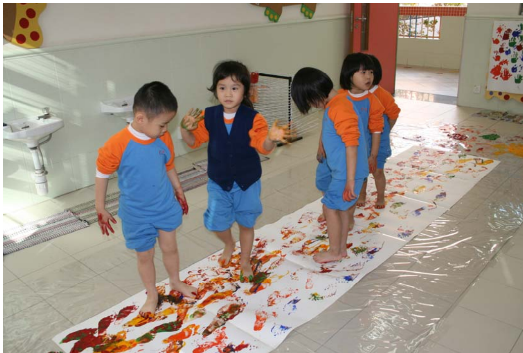
齊齊運用顏色來跳舞。