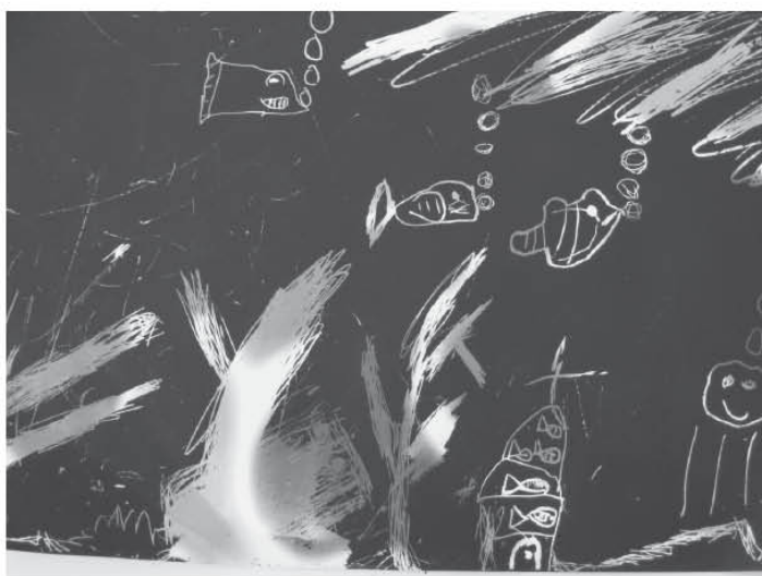
《海底世界》——用小手刮出美麗的海底世界。