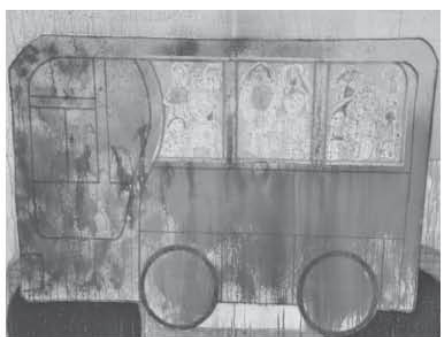
《嘖嘖樂》——用噴壺裝滿自己心愛的色彩為澳門的巴士設計車身。