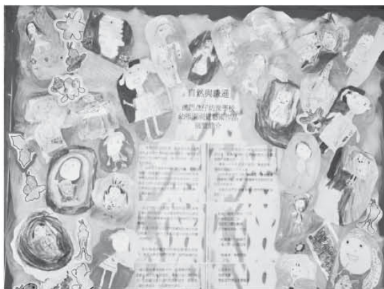
《我的媽媽》——用心的感受為媽媽打開美麗的色彩世界。